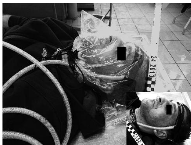
Ryc. 2. Przypadek 14, wąż doprowadzający hel pod worek foliowy.

2. Badanie toksykologiczne ofiar samobójstw dokonanych tą metodą, często wykazuje obecność leków działających depresyjnie na OUN, nawet w stężeniach śmiertelnych.